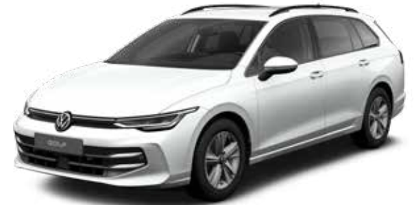
Pure White Uni-Lackierung