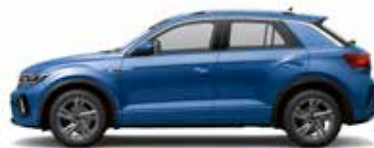
Ravenna Blue Metallic-Lackierung