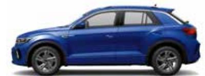
Lapiz Blue Metallic-Lackierung