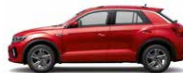
Kings Red Metallic-Lackierung