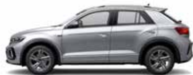
Pyrit Silber Metallic-Lackierung