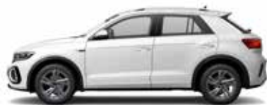
Pure White Uni-Lackierung