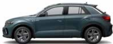
Petroleum Blue Metallic-Lackierung