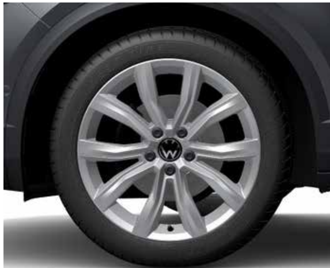
Leichtmetallrad „Grange Hill“