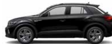
Deep Black Perleffekt-Lackierung